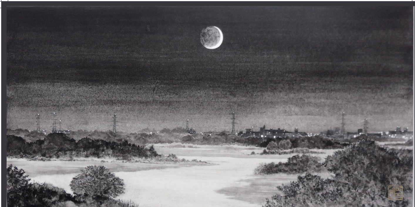
[夕刻II] パネルに和紙、墨、胡粉、2015