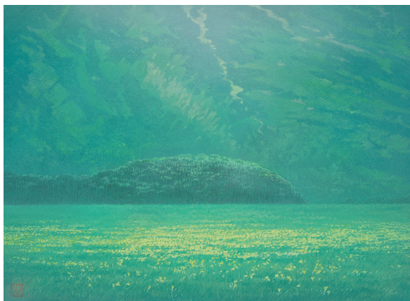
「山のうらおいに咲く」P8 和紙に岩彩 2021