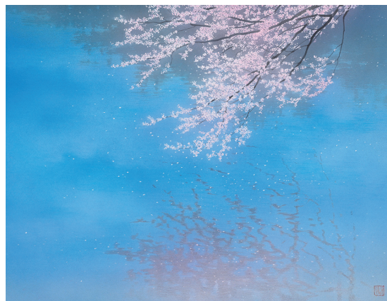
「春の風うつる」10P 和紙に岩彩 2021