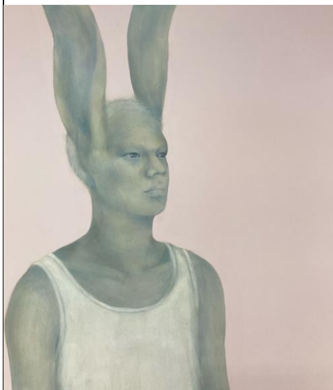
「リンジンの地へ(部分)」1620×1303mm 岩絵具、水干絵具、パステル、胡粉ジェット 2021