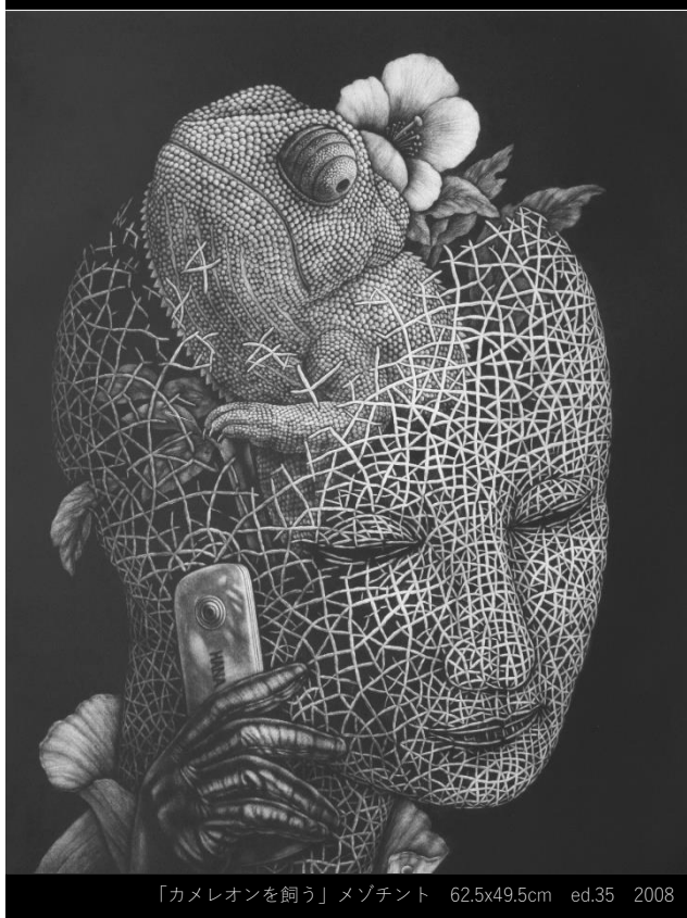
「カメレオンを飼う」メゾチント 62.5x49.5cm ed.35 2008