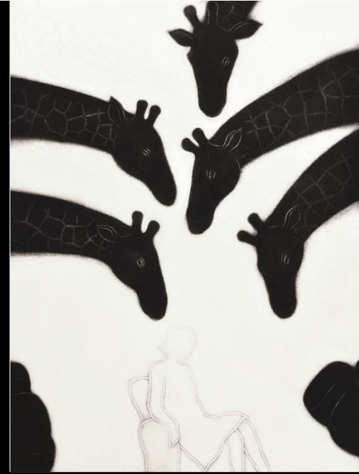
「白い間—不確定性の部屋 4」 メゾチント 65.5x49.5cm 2020