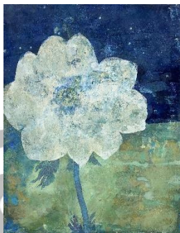
「星月夜」 F6 岩彩、他