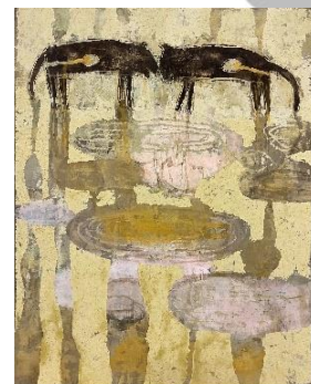
「アナトミー-3」 F30 岩彩、他