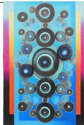
「Unty July Nov.2.2022」 M12 色鉛筆、水彩、他