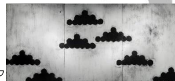
「とある真種流離譚. I」 81.0×175.2×3.0cm コラグラフ