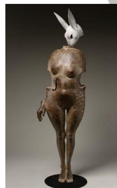
「夜想曲」 87×25×21cm 木彫彩色、他