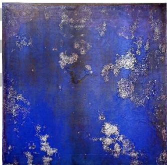
「カラ 20160902 round and round-f」 72.7×72.7cm スクリーンプリント、他