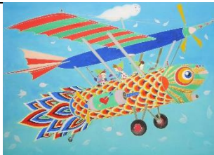
「ISORA」 F4 岩彩