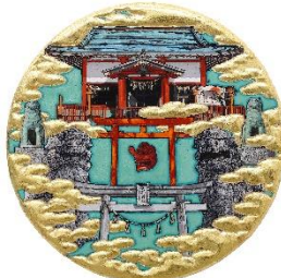
「真船神社図」 R3 アクリル、箔、他