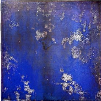
「カラ 20160902 round and round-f」 72.7×72.7cm スクリーンプリント、他