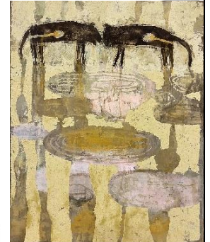
「アナトミー-3」 F30 岩彩、他