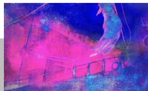
「2:41 a.m.」 M8 ビグメント、箔、他