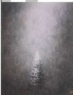
「山のいのち」 P10 岩彩