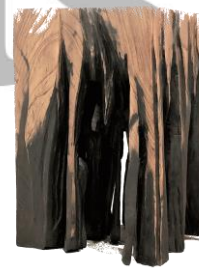
「月の森 I」 65×42×46 cm 木彫