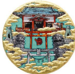
「真船神社図」 R3 アクリル、箔、他