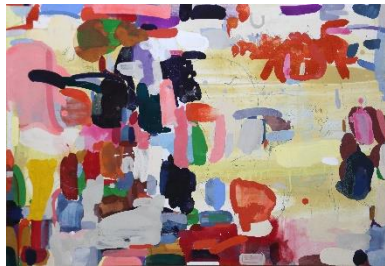
「とろか?」 72.6cm×107cm カゼインテンペラ、色鉛筆他