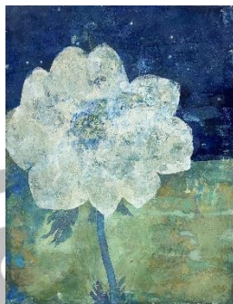
「星月夜」 F6 岩彩、他