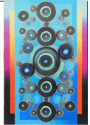
「Unty July Nov.2.2022」 M12 色鉛筆、水彩、他