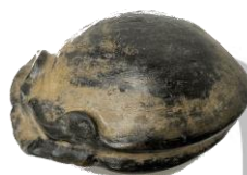
「じじみの家族 おじい」 17×29.5×28cm 脱乾漆、彩色