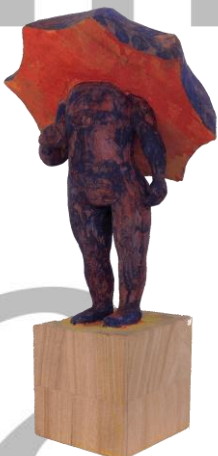
「放蕩息子」 18×37.5×15 木彫彩色