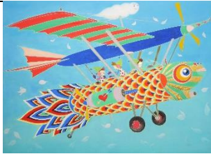
「ISORA」 F4 岩彩