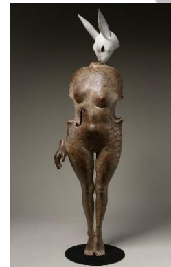
「夜想曲」 87×25×21cm 木彫彩色、他