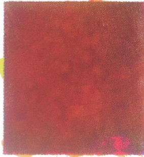
「D.K.D.S.d. No.10」 38×28.5cm スクリーンプリント、他