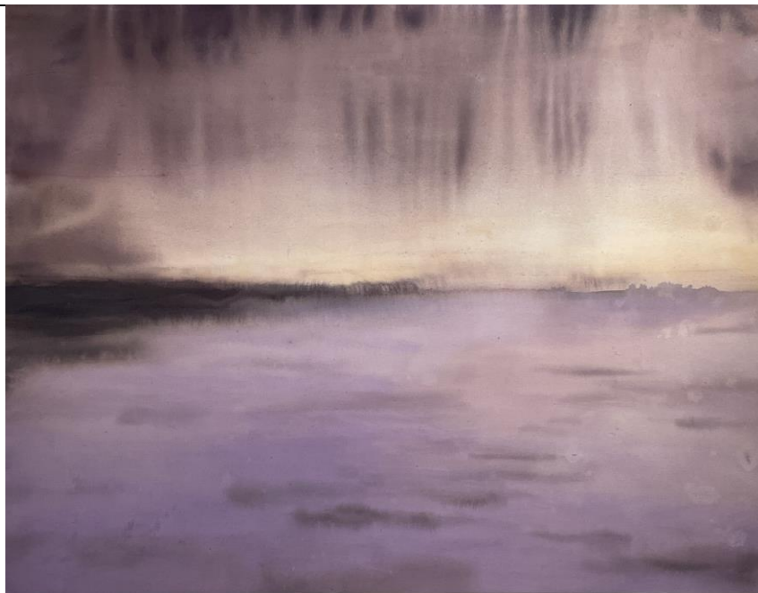
「いつかの夕暮れ」 F80 綿布キャンバスにアクリル絵具 2022