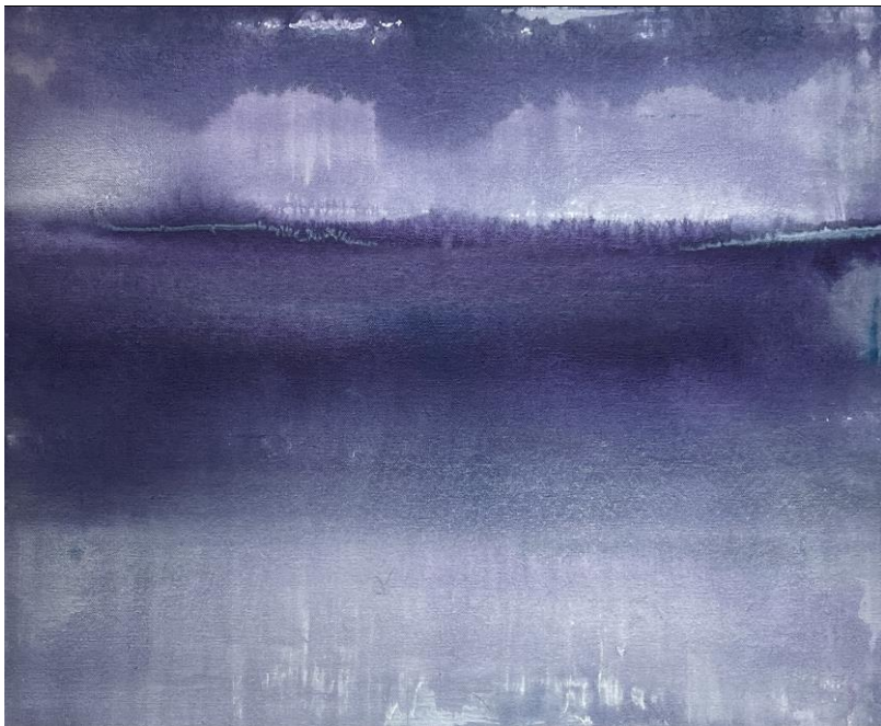
「雨の日」 F8 綿布キャンバスにアクリル絵具 2022