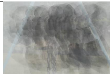
「Fragment of memory」 F120 白麻紙、墨、胡粉他