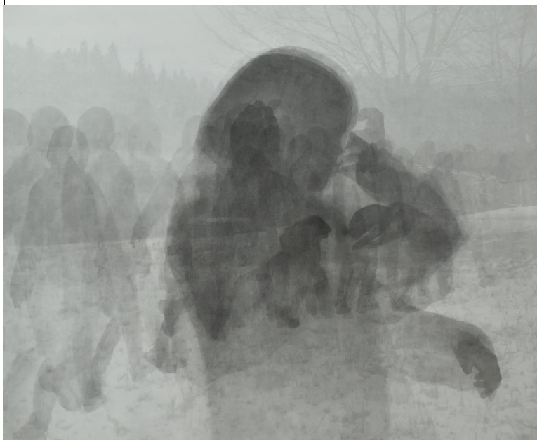
「After image」 606×727mm 白麻紙、墨、胡粉、インクジェットプリント