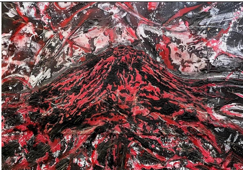
「ENCOUNT RED LABEL」 1500×2100mm 木製パネル、岩絵具、樹脂モルタル、アクリル、炭酸カルシウム