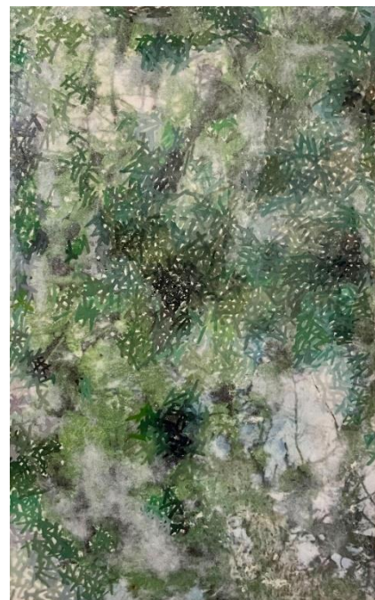
「raw-resuscitation」 273×160mm 和紙、樹脂、インク、顔料、アクリル絵具