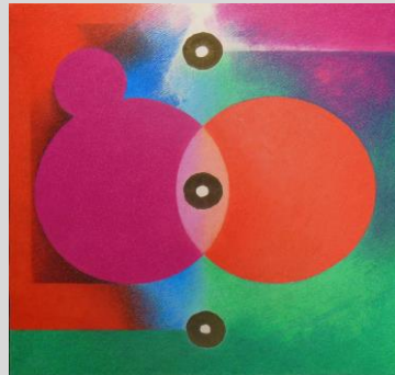
「交換—to the harmony」 S6 紙、色鉛筆、墨、他