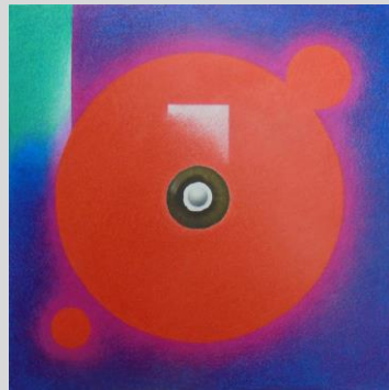
「交換—to the harmony」 S4 紙、色鉛筆、墨、他