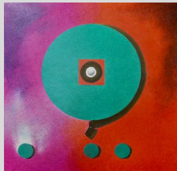
「交換—to the harmony」 S6 紙、色鉛筆、墨、他