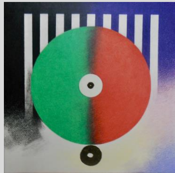
「交換—to the harmony」 S4 紙、色鉛筆、墨、他